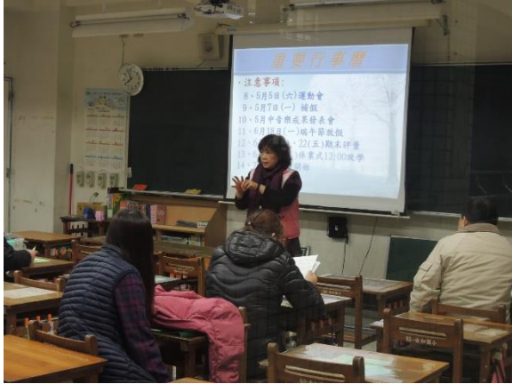
親師良好互動與溝通