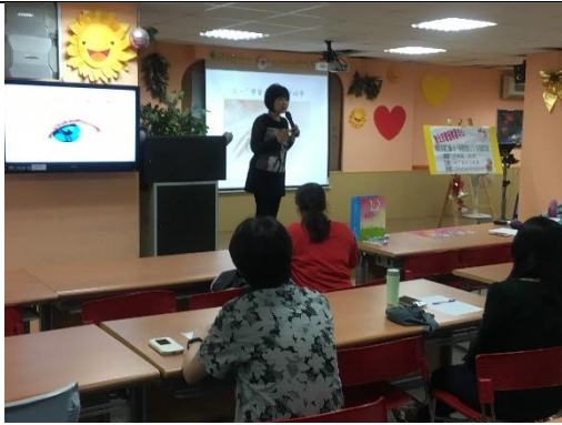
校長與家長熱烈互動