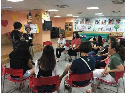
帶領人與學員相見歡