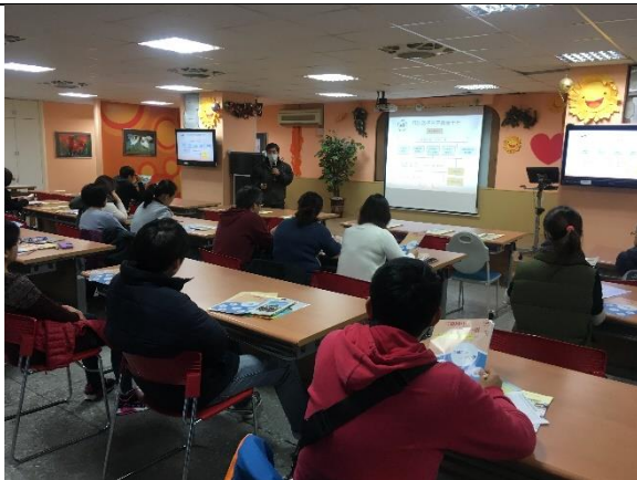
私校招生講座情形