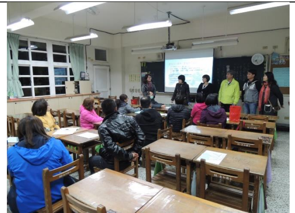
親師良好互動與溝通