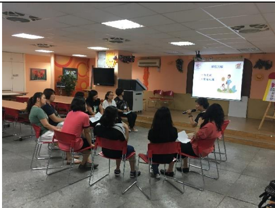
互相分享討論議題