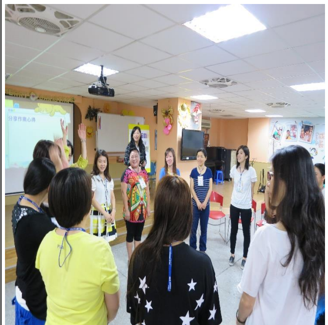
建立團體的信賴感與凝聚力