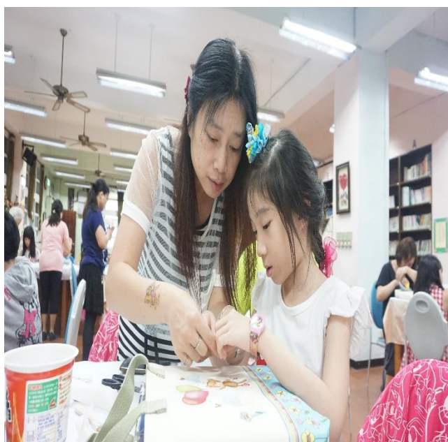
親子協力，享受手作樂趣