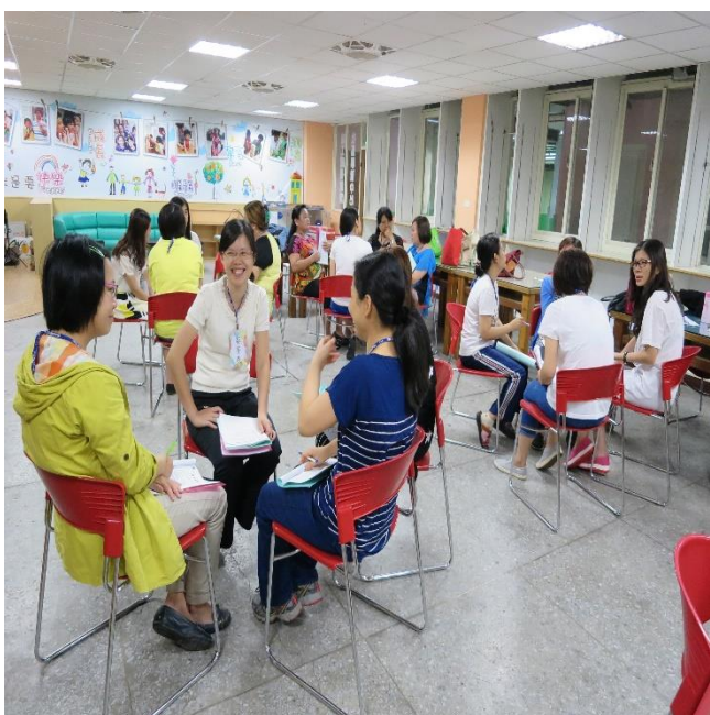
分組討論情境的處理方式