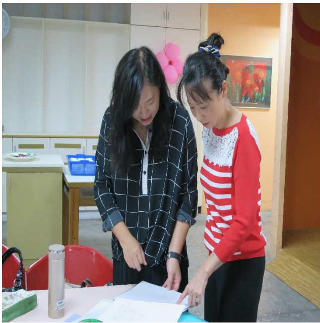
帶領者課程準備與分享