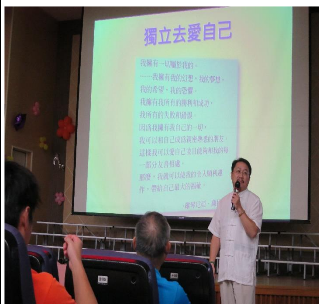
透過實務經驗分享親師生間有效的輔導策略。