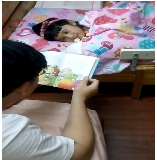
爸爸媽媽說故事比賽獲獎作品