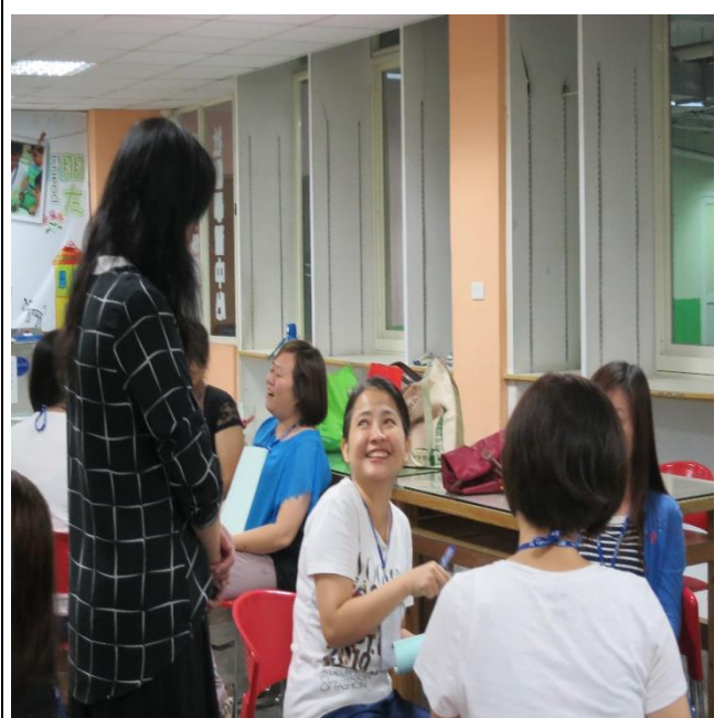
透過分享，進而學習與成長