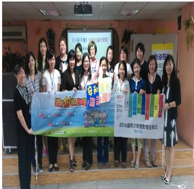
團體夥伴的陪伴與打氣，分享各界學習資訊。