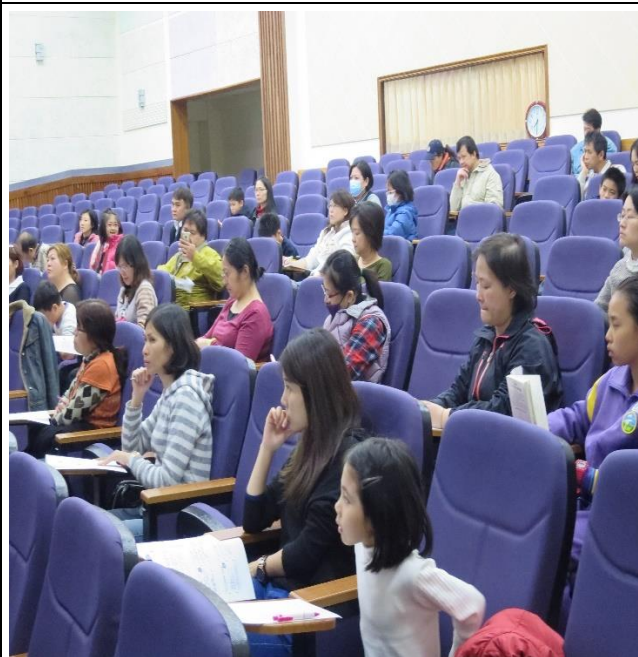
家長們聚精會神的聆聽