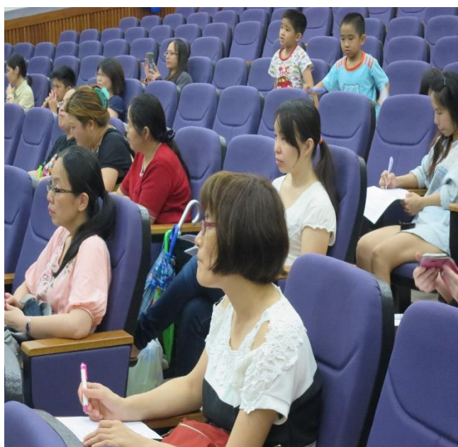
家長聚精會神聆聽