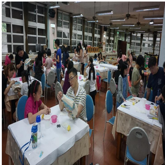
親子協力，享受手作樂趣