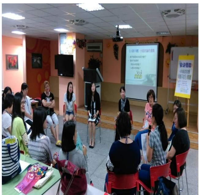
透過聆聽與溝通，學習價值澄清與解決策略。