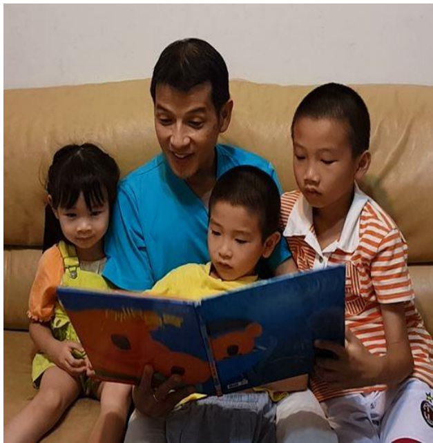
爸爸媽媽說故事比賽獲獎作品