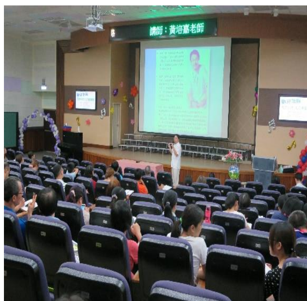
家長與老師踴躍參與，座無虛席