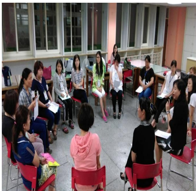
團體成員的分享與回饋。