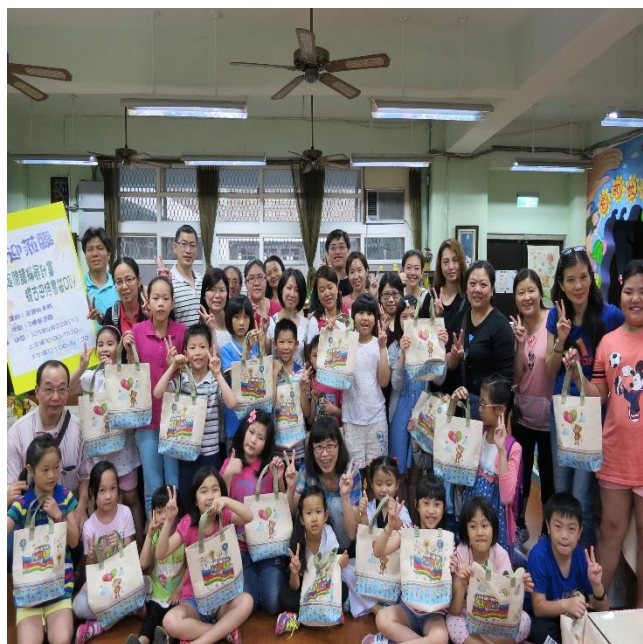
親子快樂學習，展示書袋作品