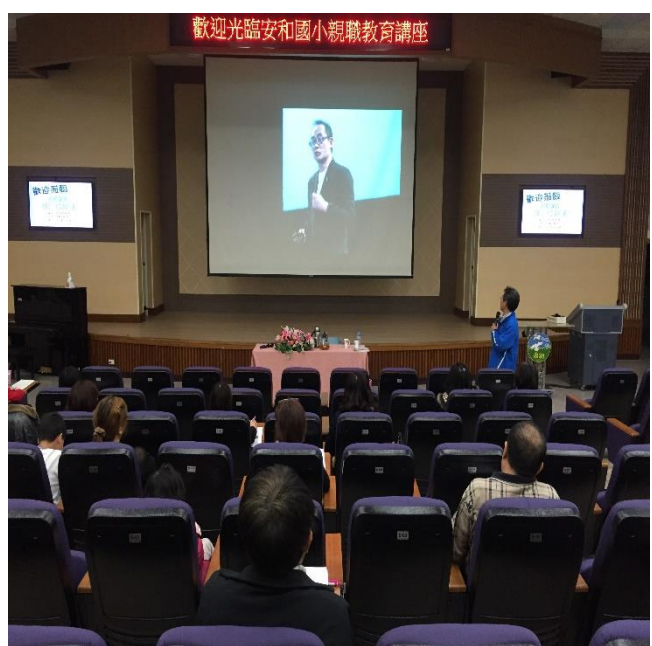
影片欣賞，討論有效的溝通方法