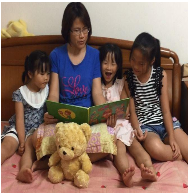
爸爸媽媽說故事比賽獲獎作品